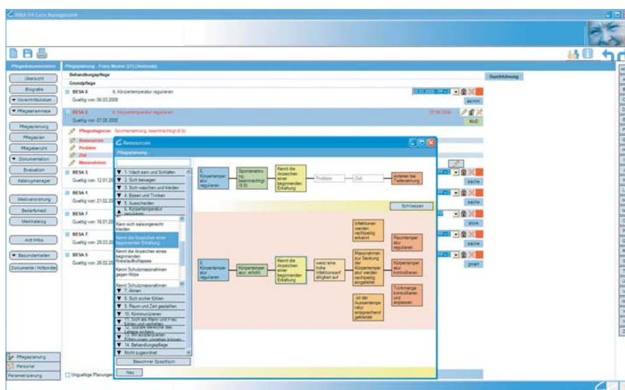
iNKA™ Pflegeplanung mit Pflegepfad

Im Allgemeinen umfasst die daraus resultierende mittelfristige Strategie für die weitere Fachentwick-